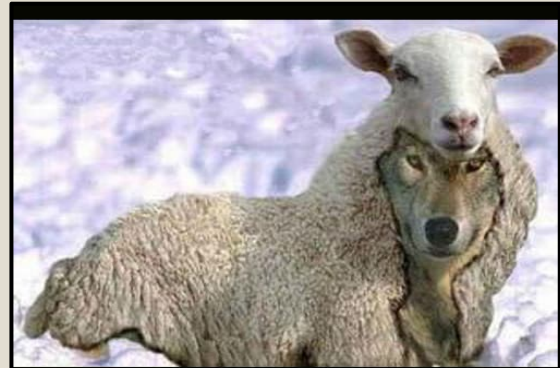
Jeremías y los falsos profetas

“Hasta el fin del tiempo, se levantarán hombres que querrán crear confusión y rebelión entre los que aseveran ser representantes del Dios verdadero. Los que profetizan mentiras alentarán a los hombres a considerar el pecado como cosa liviana. Cuando queden manifiestos los terribles resultados de sus malas acciones, procurarán, si pueden, responsabilizar de sus dificultades al que los amonestó fielmente, así como los judíos culparon de su mala suerte a Jeremías. Pero tan seguramente como en la antigüedad quedaron justificadas las palabras de Jehová por medio de su profeta, se demostrará hoy la certidumbre de sus mensajes”.